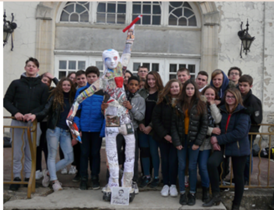
1er Prix départemental 2016

Des élèves pleinement investis sur l'épreuve individuelle comme sur la production d'œuvres collectives.