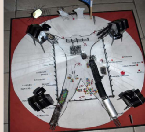
1er Prix départemental 2017