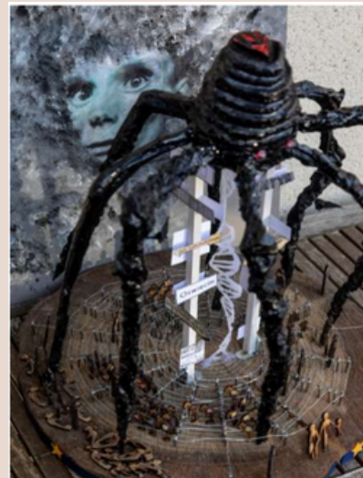
1er Prix national 2019