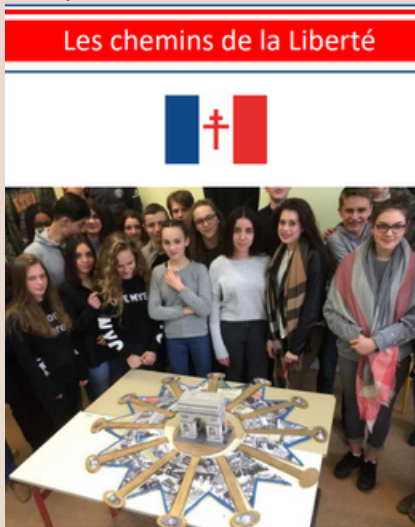
1er Prix national 2018