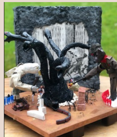
1er Prix départemental 2022